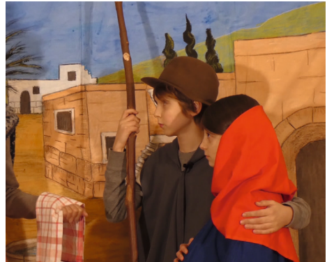
Maria und Josef